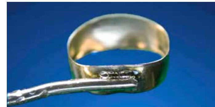
Schweißen von KFO-Bändern