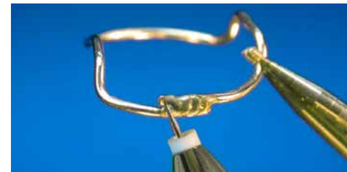
Verbinden von Edelstahldrähten